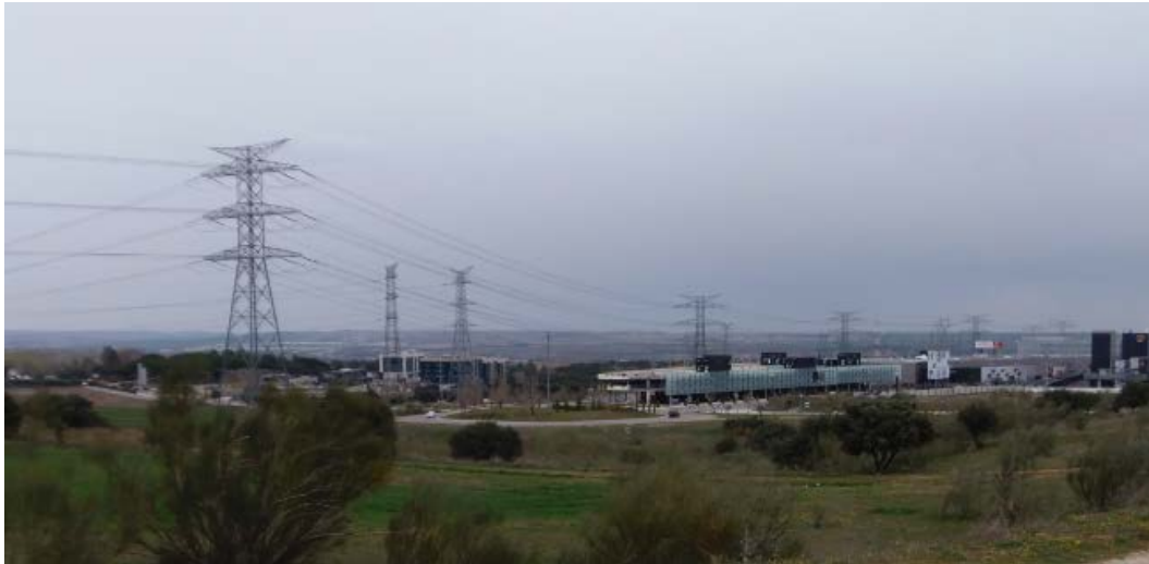
Lineas aéreas de alta tensión procedentes de la subestación de San Sebastián de los Reyes en el límite norte del sector S-1