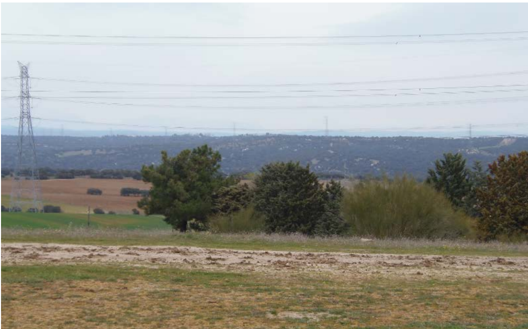
LAT en la zona noroeste del sector S-1, en esta zona se plantea el traslado de la línea