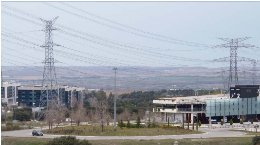
Detalle de las líneas