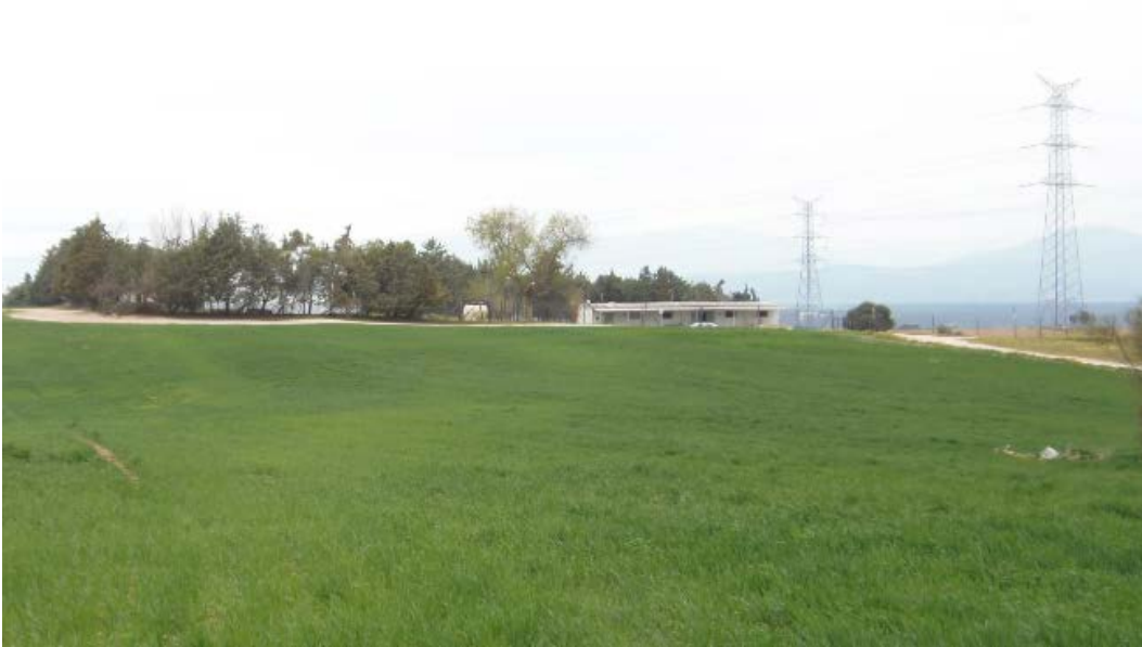
LAT por el límite norte del sector s-1. En esta zona se plantea un pasillo eléctrico